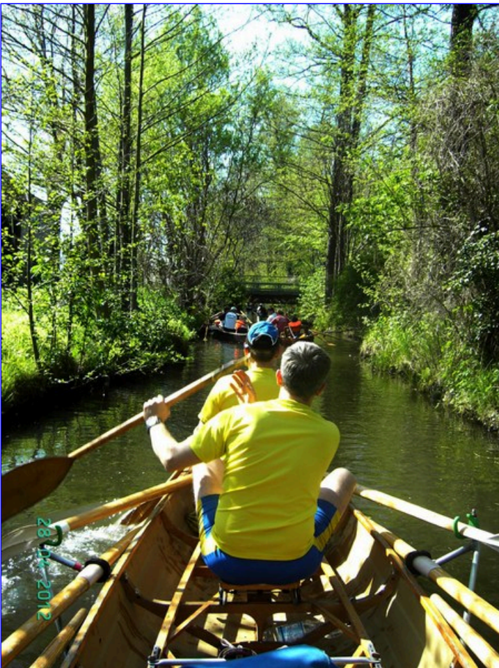
hat und das Wetter mitspielt, trifft man sich abends zu einem Nachttrunk auf der Bank