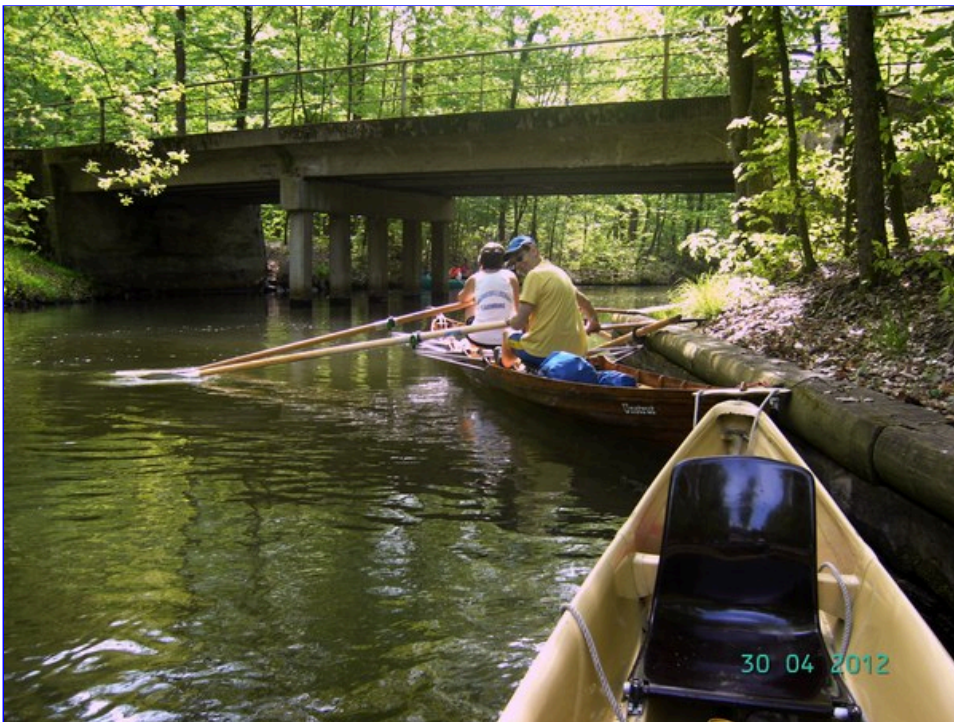
und weiter über den Dahme - Umflutkanal bis nach Märkisch Buchholz. Hier mussten die Boote über Bootsschleppen umgesetzt werden.