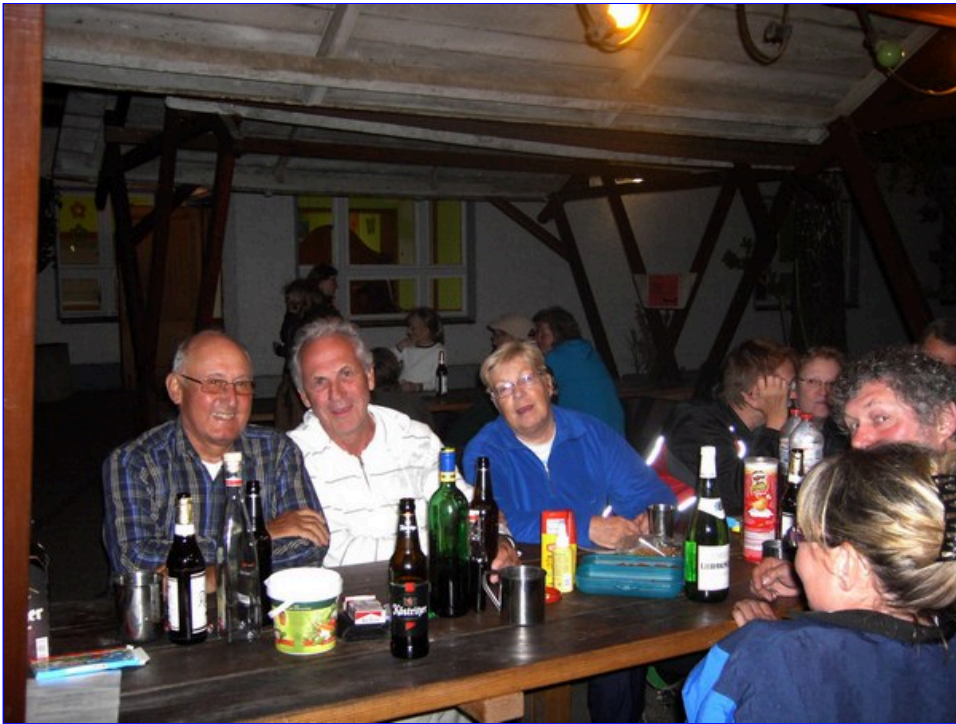
und hat sich natürlich lieb.