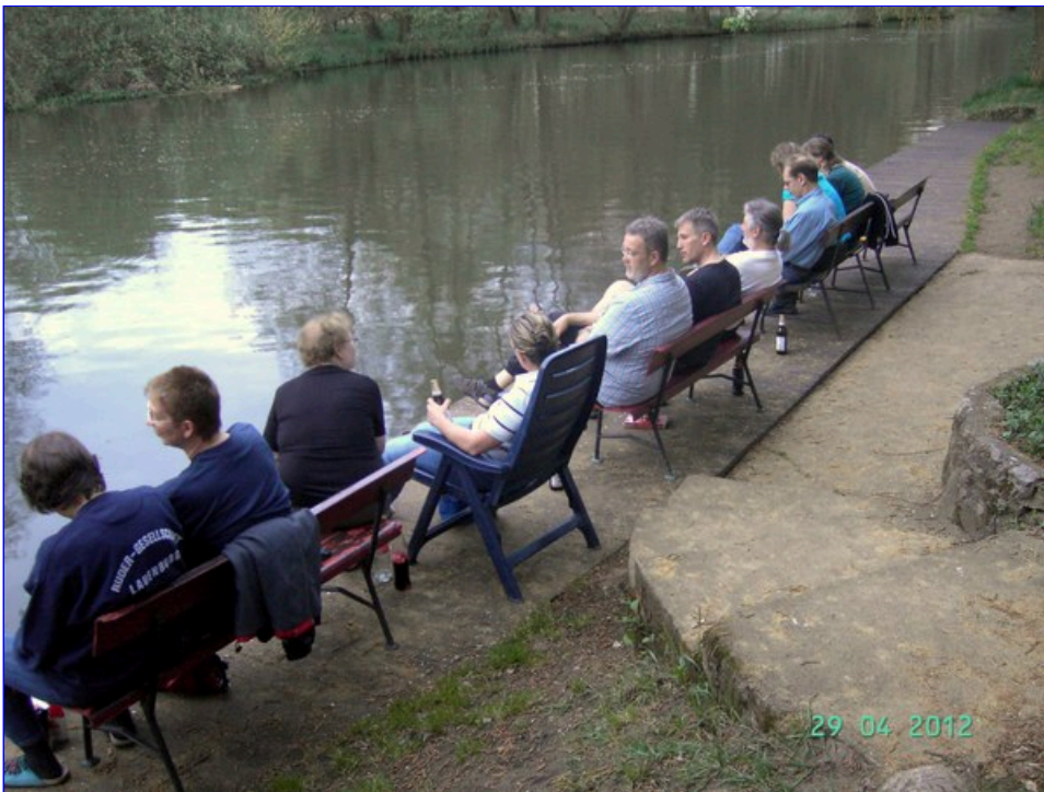
Wir verlassen Burg in Richtung Köthen und rudern von Mücken geplagt über den Puhlstrom.