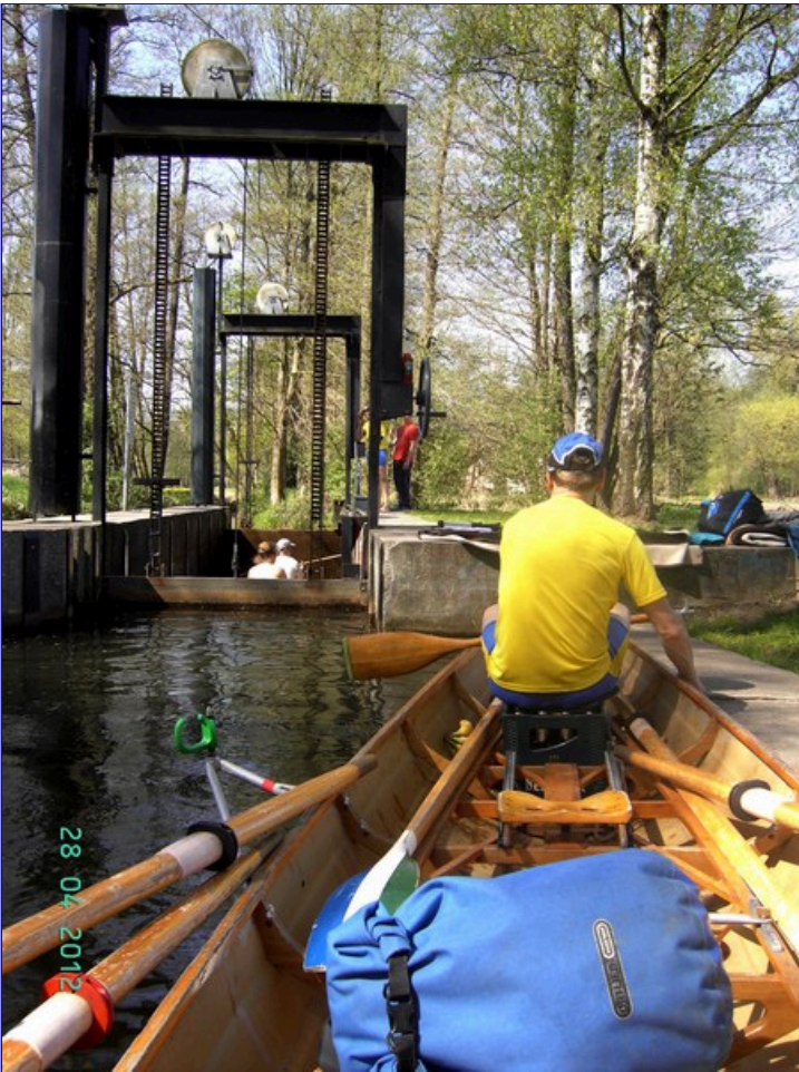
Wenn man dann so den ganzen Tag gerudert oder gepaddelt