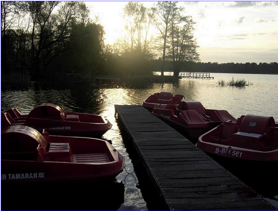
Gemeinsam genießt man den milden Abend