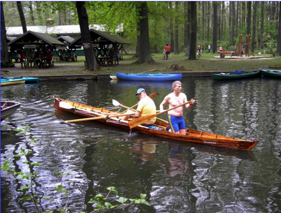
Wieder zurück in Burg klingt der Schönwettertag am Wasser aus.