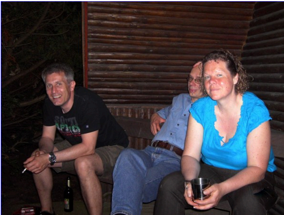
und findet den VL einfach süß.