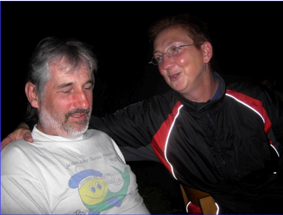
Im Speewald gehört es für uns zum Pflichtprogramm einmal beim Spreewaldhof, bei Buchhans vorbei zu schauen und etwas gegen die Unterhopfung zu tun.